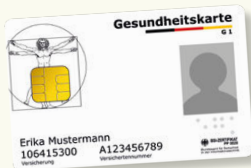
Exemplu model al unui card de sănătate

Va rugăm să aveți cardul electronic de sănătate permanent la dumneavoastră, când utilizați serviciile de sănătate. Începând cu 1 ianuarie 2015 acest card este exclusiv valabil ca dovadă de autorizare pentru a putea beneficia de serviciile asigurării de sănătate obligatorie. Pe cardul electronic de sănătate sunt salvate ca date obligatorii numele, data nașterii și adresa dumneavoastră cât și numărul dumneavoastră de asigurat medical și situația dumneavoastră de asigurat (membru, asigurat al familiei sau pensionar). Cardul electronic de sănătate conține și o fotografie cu dumneavoastră.