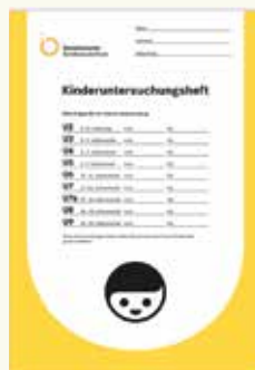
So sieht ein „U-Heft“ aus.

Diese Untersuchungen sind sehr wichtig. Bitte nehmen Sie deshalb all diese Untersuchungen wahr und bringen Sie immer das Untersuchungsheft („U-Heft“) sowie den Impfpass Ihres Kindes mit. Die Untersuchungen dienen der Gesundheit Ihres Kindes.