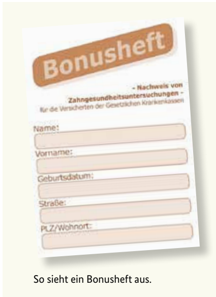
So sieht ein Bonusheft aus.

Gesunde Zähne sind ein Stück Lebensqualität. Deshalb sind regelmäßige Vorsorgeuntersuchungen wichtig – auch wenn Sie keine Beschwerden haben. Die gesetzlichen Krankenkassen übernehmen auch die Kosten dieser Vorsorgeuntersuchungen. Diese Untersuchungen helfen, bestimmte Erkrankungen frühzeitig zu erkennen und zu behandeln. Sie können dafür von Ihrer Krankenkasse ein sogenanntes „Bonusheft“ erhalten. In diesem Heft werden die Vorsorgeuntersuchungen eingetragen. Wenn Sie nachweisen können, dass Sie mindestens einmal im Jahr (unter 18 Jahren mindestens einmal pro Halbjahr) bei einer Zahnärztin oder einem Zahnarzt waren, zahlt die Krankenkasse einen höheren Zuschuss, sofern ein Zahnersatz notwendig wird.